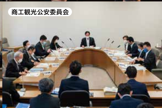
商工観光公安委員会