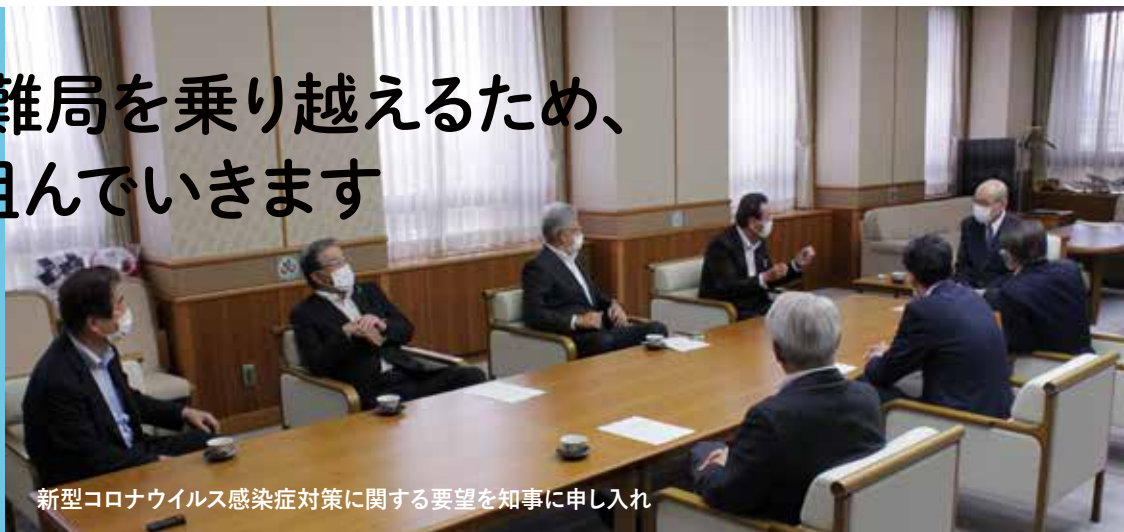
新型コロナウイルス感染症対策に関する要望を知事に申し入れ