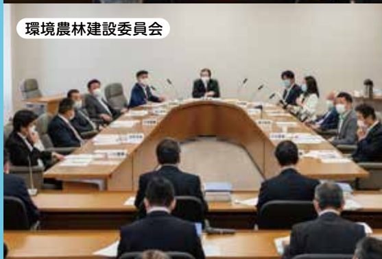
環境農林建設委員会