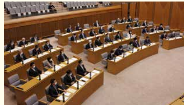
4月に臨時会を開き、緊急対策を盛り込んだ補正予算案を質疑

県内では2月に感染者が確認され、感染拡大が続き、病院や企業などでのクラスター（小規模な集団感染）も発生しました。県では、不要不急の外出の自粛要請、休業要請に応じた中小企業・個人事業主への協力金支給など、多種多様な施策を展開。より県民の実情に沿った取り組みとなるよう、県議会でも知事への申し入れや多岐にわたる質疑を展開しています。