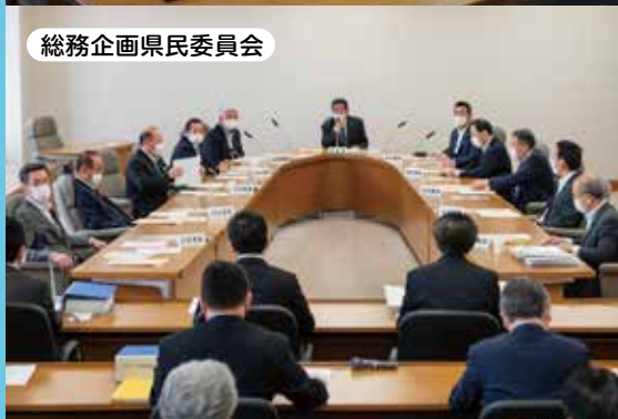
総務企画県民委員会