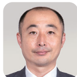
ほうだつ のりひさ 寶達 典久(1期) (自由民主党)