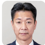
ば ば ひろかつ 馬場 弘勝(1期) (自由民主党)