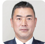
しみず しんいちろう 清水 真一路(2期) (自由民主党)