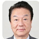
さくの ひろあき 作野 広昭(6期) (自由民主党)