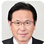
あんじつ たかなお 安実 隆直(2期) (自由民主党)