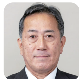
たかつき のぶゆき 高辻 伸行(1期) (自由民主党)