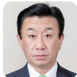
よこやま たかや 横山 隆也(3期) (自由民主党)