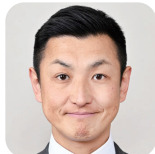
ふわ ひろひと 不破 大仁(4期) (自由民主党)