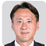
かねい けんたろう 金子 健太郎(1期) (自由民主党)