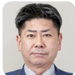
くるま ゆきひろ 車 幸弘(3期) (自由民主党)