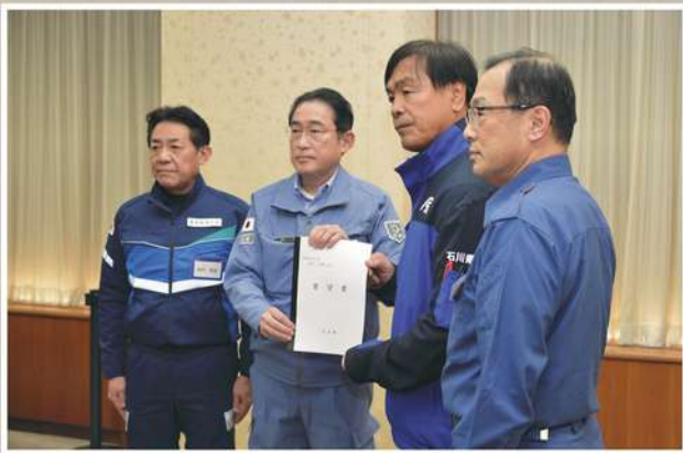
岸田総理大臣に要望書を提出しました(石川県庁にて、右は焼田議長)