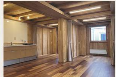
輪島キリコ会館多目的広場に設置された応急仮設住宅