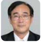
徳野 光春 (自由民主党)