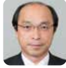
谷内 律夫 (公明党)