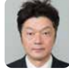
田中 敬人 (自由民主党)