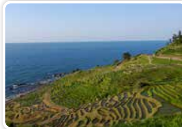
白米千枚田（輪島市）

里山里海をはじめとした豊かな環境の保全や農林水産業の振興、県民の暮らしに密接にかかわる道路や河川の整備などに関して慎重な審議を重ねています。