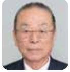
向出 勉 (自由民主党)