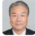
作野 広昭 (自由民主党)