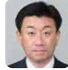
横山 隆也 (自由民主党)