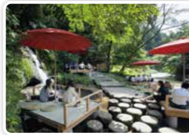
鶴仙溪の川床（加賀市）

県内の商工業の振興、雇用対策、国内外からの誘客、国際交流の推進などの課題を議論。県内の治安や交通事故の抑止などもテーマとして取り扱っています。