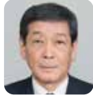
山口 彦衛 (自由民主党)