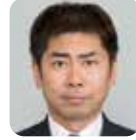
車 幸弘 (自由民主党)