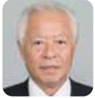
藤井 義弘 (自由民主党)