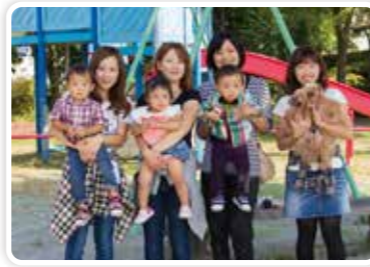
少子化対策などについて活発に議論

県民の日常生活に密接にかかわるテーマをピックアップ。結婚や出産、子育て、教育、介護、医療、生涯学習、スポーツ振興などに県民の声を反映するのが目的です。