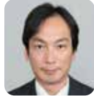
平蔵 豊志 (自由民主党)