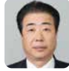
増江 啓 (公明党)