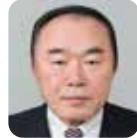
和田内 幸三 (自由民主党)