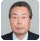
稲村 建男 (自由民主党)