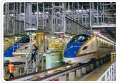
白山総合車両所（白山市）

県政運営の核となる行財政改革や県民の安全・安心にかかわる危機管理、新幹線・空港などの交通政策、文化振興施策の推進などについて議論を深めています。