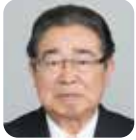
福村 章 (自由民主党)