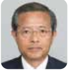
田中 哲也 (自由民主党)