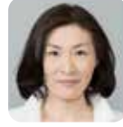
安居 知世 (自由民主党)