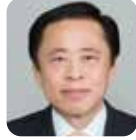
吉崎 吉規 (自由民主党)