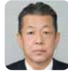
かほく市選挙区 1人