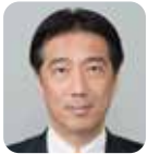
井出 敏朗 (自由民主党)