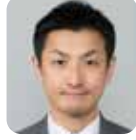
不破 大仁 (自由民主党)