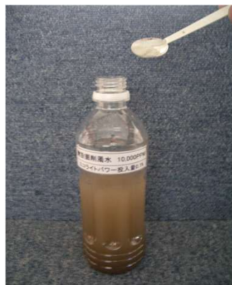
凝集剤投入 0.3g (0.1%)