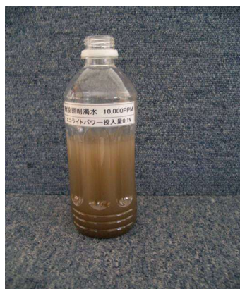
濁水物：建設掘削土 濁水量：300CC 濃度：10,000ppm