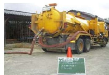
濁水をバキュームで 直接搬出処分