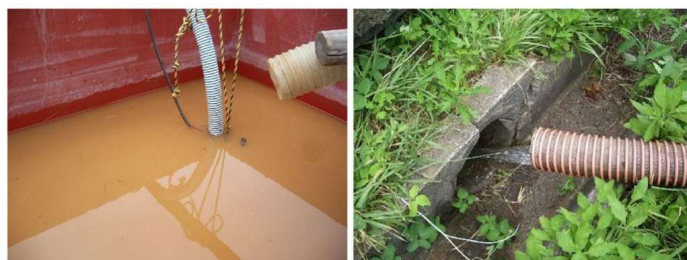
仮設タンクに貯留した濁水に凝集剤を添加し凝集沈殿させ上澄み液を排出