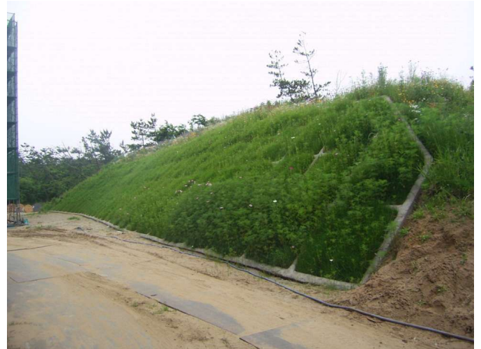
施工後の植生状況