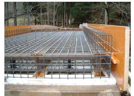
横繫鉄筋および桁上面鉄筋配筋