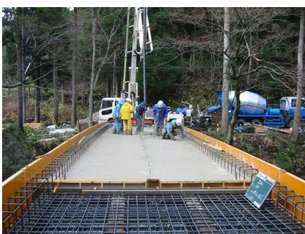
橋体コンクリート打設