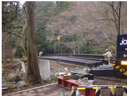
ゴム支承設置・桁架設