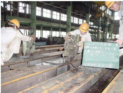
桁工場製作（孔あけ加工）