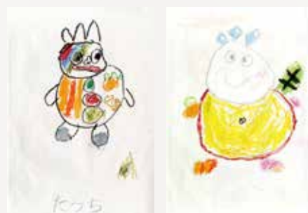
ペンネーム たっち