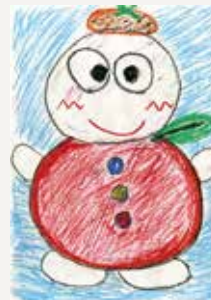
ペンネーム たっち