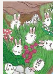
ペンネーム 金太郎