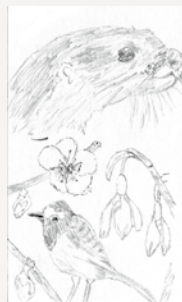
ペンネーム ミルクレーブ