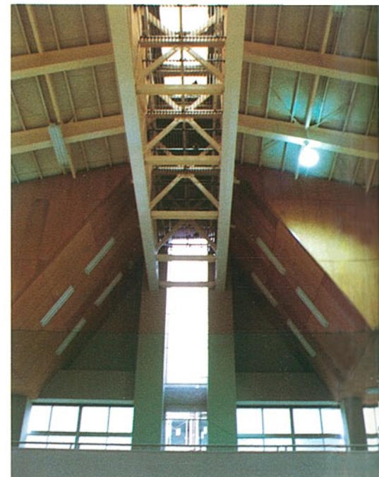
体育館トップライト