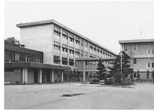
大聖寺高等学校 加賀市大聖寺永町