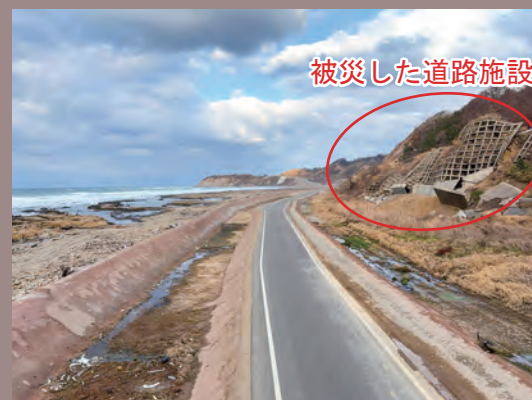
被災した道路施設