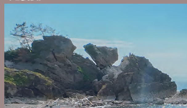
かつては中央に窓のような穴がある奇岩だったが、地震により崩壊