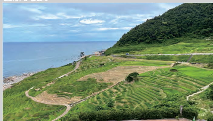
世界農業遺産「能登の里山里海」を代表する景観 四季の移ろいが織りなす原風景が、訪れる人を魅了する