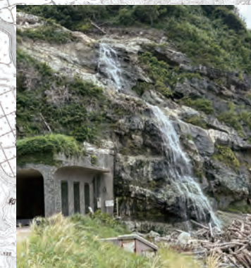
白糸のような滝が、山から海へと直接流れ落ちる全国的にも珍しい滝