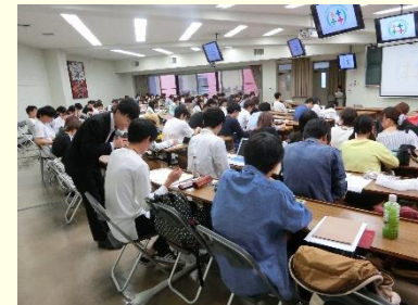
←大学での出前講座