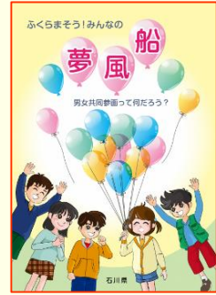
←小学生向け漫画形式の副読本