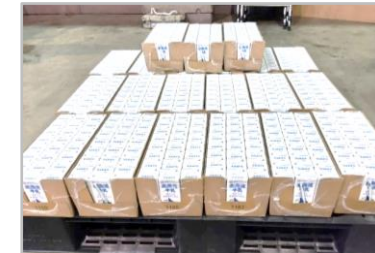
牛乳、野菜ジュース