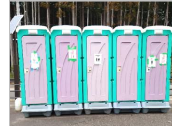
仮設トイレ (800基以上)