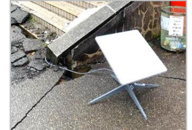
衛星通信装置 (600台以上)