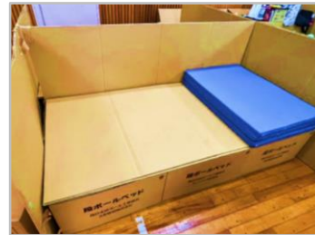
段ボールベッド (6千台以上)