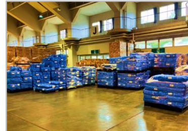
ブルーシート (6万枚以上)