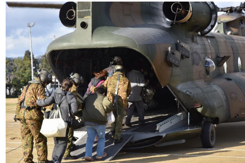
自衛隊ヘリによる住民の移送