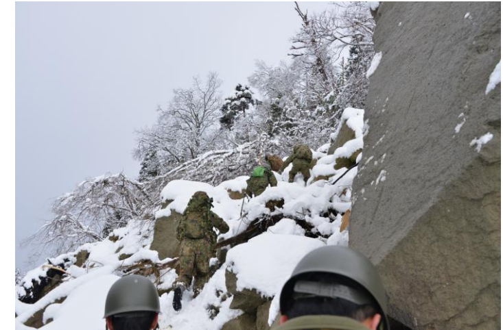
孤立集落に対する自衛隊支援