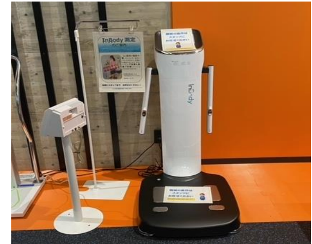
インボディ（体成分分析装置）