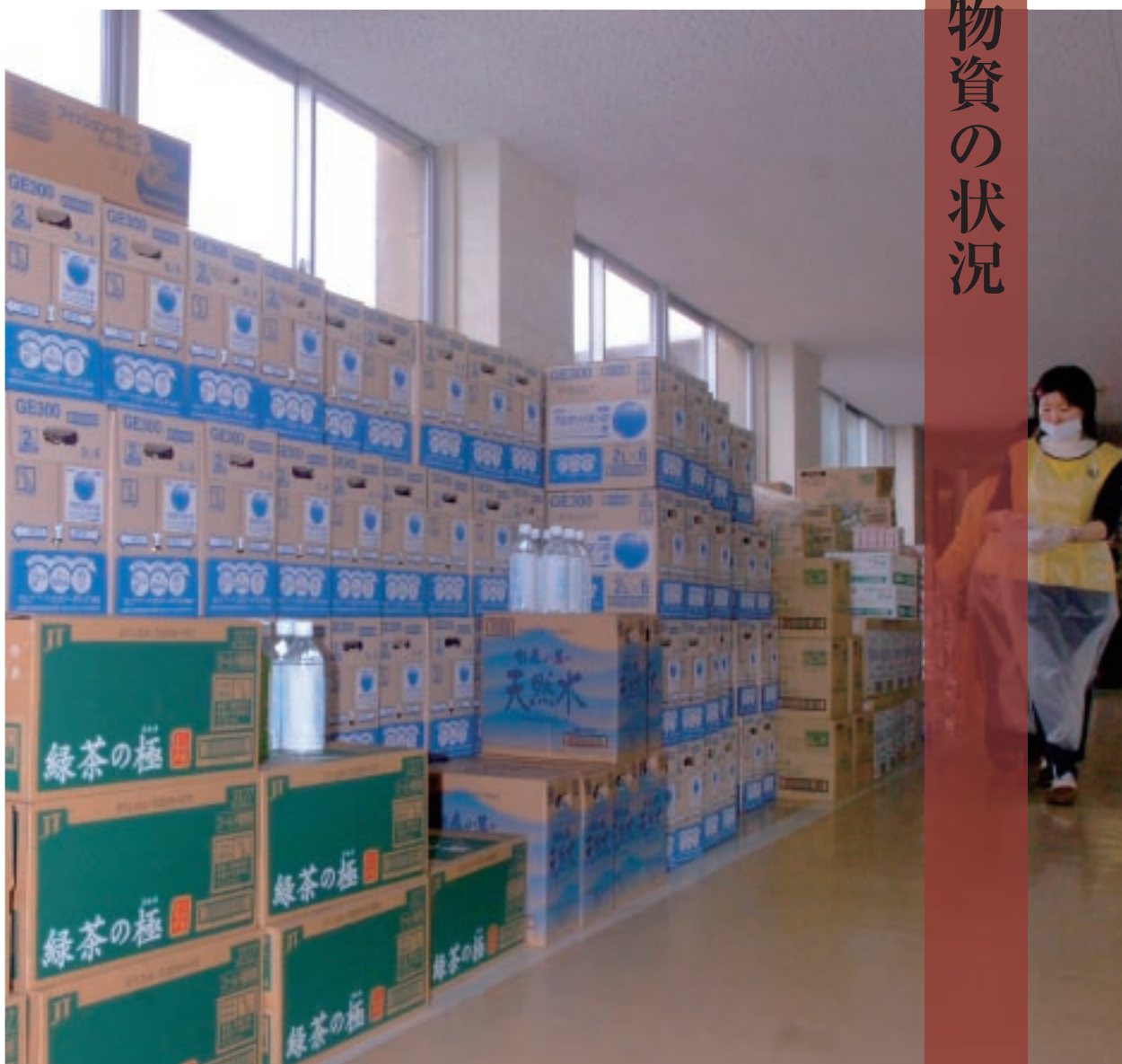
被災地に届けられた救援物資＝4月4日、輪島市門前町の門前西小学校