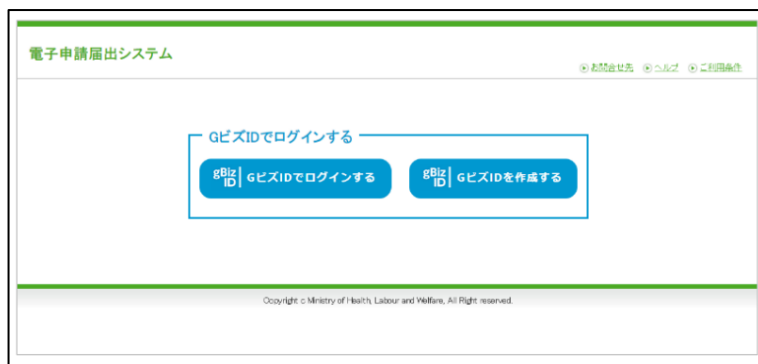
【本システムのログイン画面イメージ】

本システムでご利用できるGビズIDのアカウント種類は、「gBiz IDプライム」と「gBiz IDメンバー」のみになります。