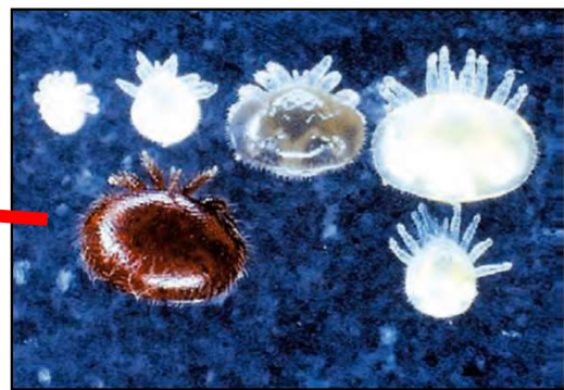
ミツバチヘギイタダニ