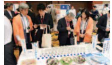
商談会での県産食材提案