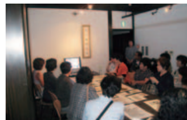
女性グループ交流会