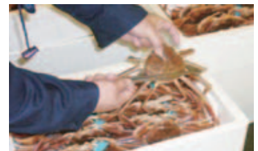
ズワイガニの資源管理

・内水面における環境保全の取り組みを支援するとともに、体験イベントの開催などを通じて県民の理解と関心の増進に努めます。