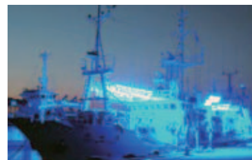
LED集魚灯の導入試験

・「石川型スローツーリズム」の推進により漁村地域に人を呼び込み、漁業を中心とした多様な収入源の確保につなげます。