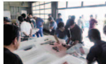
鮮度保持技術の講習会