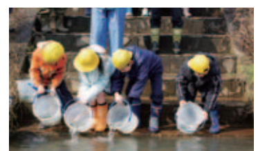
児童の稚魚放流体験