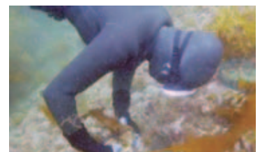
海女による母藻の設置