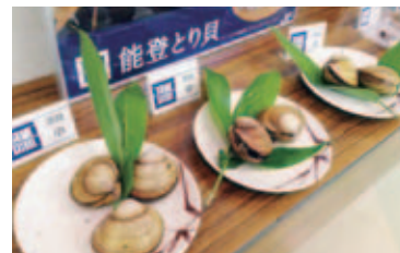
新たな養殖対象種の開発 (能登とり貝)