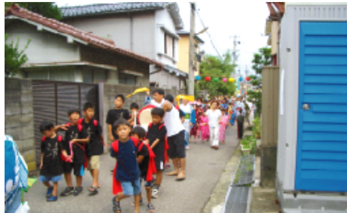
地域のお祭りの様子

地域や学校等の行事に参加することは、地域の連帯が深まり犯罪者を寄せ付きにくくする。