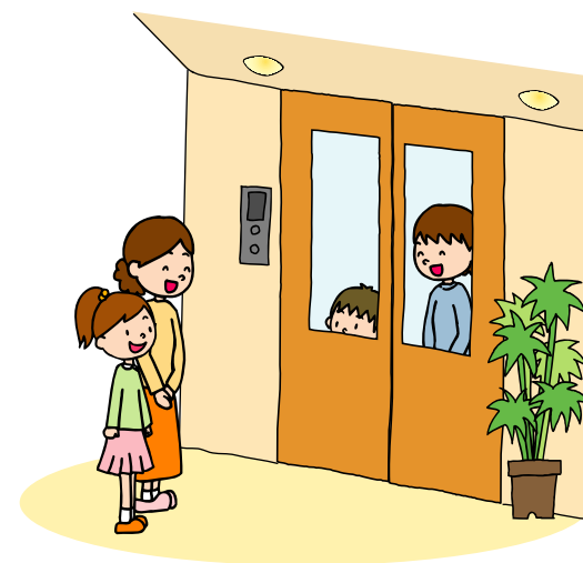
窓が付いている扉は、エレベーター昇降口からかご内が見通せるため、防犯性が高い。