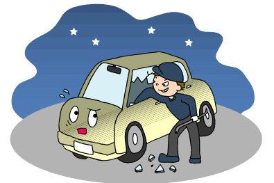
照度が確保されていないと…

(注11)「人の行動を視認できる程度以上の照度」とは、4メートル先の人の挙動及び姿勢等が識別できる程度以上の照度(平均水平面照度がおおむね3ルクス以上)をいう。(平成12.2.24 警察庁丙生企発47号 安全・安心まちづくり推進要綱から)