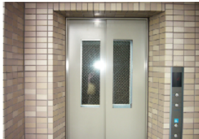
防犯窓付きエレベーター扉