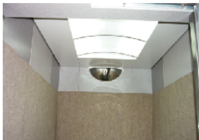
ミラーの設置されたエレベーターかご内