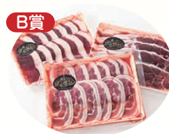
賞品写真はイメージです