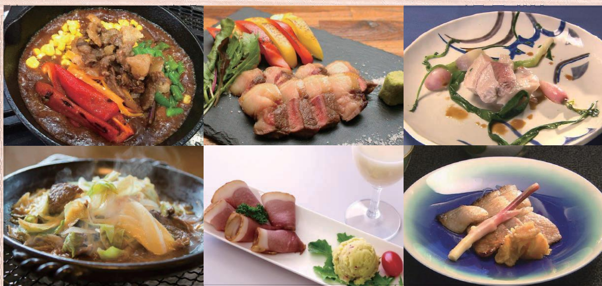
掲載写真はイメージです

いしかわジビエ料理フェアは、こまつ地美絵、白山麓猪、のとしし協賛店などと連携して、ジビエ料理を上記の期間、みなさんに提供します。