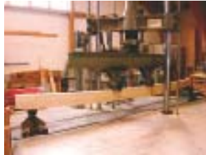
実大曲げ強度試験

スギ、能登ヒバなど県産材の人工乾燥技術の確立、強度性能評価、新たな用途開発に取り組んでいます。