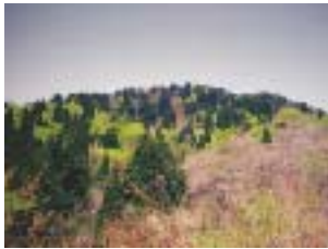
スギとブナの混交林

健全な海岸マツ林の再生や針広混交林化など多様な森林機能を高めるための森林施業の確立に取り組んでいます。