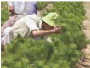
マツノザイセンチュウ接種検定

マツ材線虫病やアテ漏脂病など病虫害に強い林木の選抜育成、スギ花粉症に対応するための無花粉スギの育成に取り組んでいます。