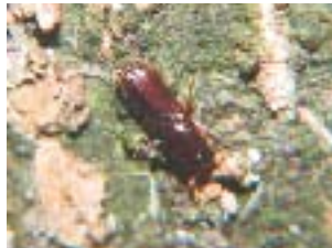
広葉樹を枯らすカシノナガキクイムシ

マツ材線虫病やカシノナガキクイムシによる集団枯損被害、クマによるスギ剥皮被害、アテ漏脂病被害などの防除技術の確立に取り組んでいます。