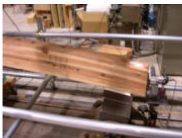
ロッド取付タイプ B