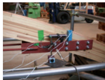
ロッド取付タイプ C