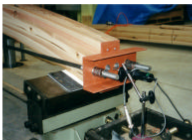
ロッド取付タイプ A