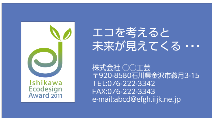
濃い背景色の場合 (白地窓タイプ表示) 看板、広告など