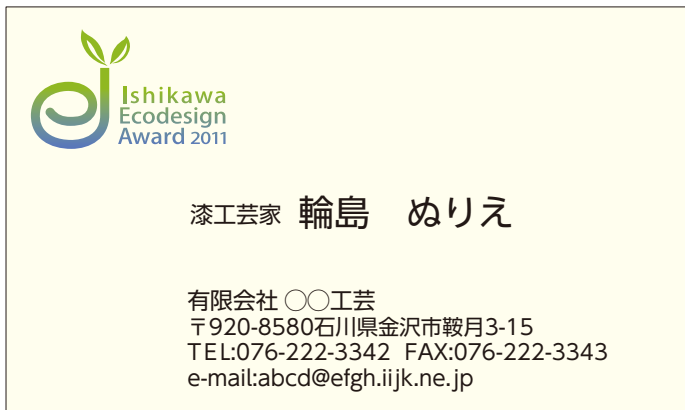
薄地の背景色の場合 (ポジタイプ表示) 名刺、封筒など