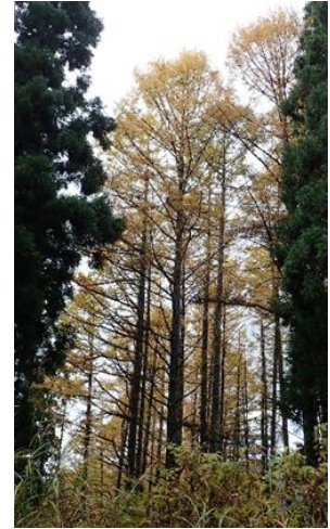
写真 カラマツ造林地

カラマツは、寒冷地に強く、樹形が安定し、成長が早い等の利点を持つ造林樹種の一つである。近年、合板等木材としての需要が高まっているため、再造林樹種にカラマツを検討している林業事業者は少なくない。しかし、県内での造林履歴(写真)はあるものの、植栽に適した立地や施業体系など不明な点が多い。そこで、県内に成林しているカラマツ造林地を調査し、再造林樹種の可能性について検討する。