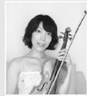
藤原 明代(ヴァイオリン)