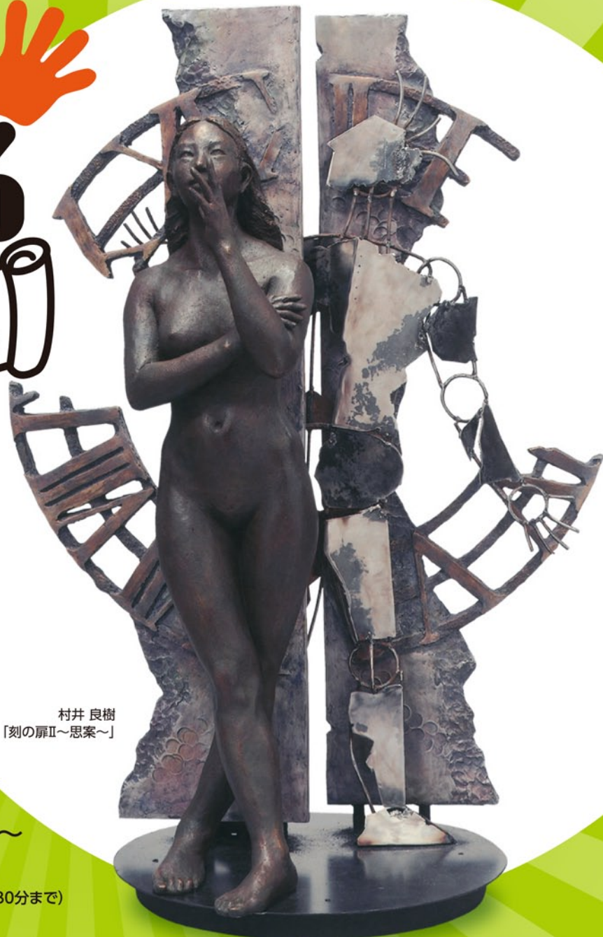
村井 良樹 「刻の扉II～思索～」

文化芸術を肌で感じられる「ふれてみるいしかわの文化展」を 7日間にわたって開催します。どなたでもお楽しみいただける 内容ですので、ぜひご来場ください。