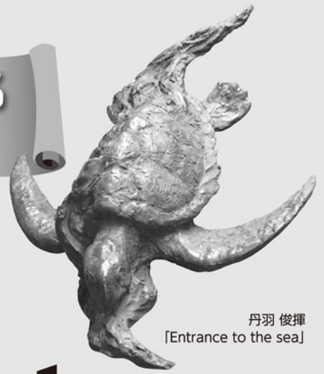
丹羽 俊揮 [Entrance to the sea]

北陸日彫会会員の作品を展示します。すべての作品をじかに手でふれて鑑賞することができます。形や素材の質感にふれ、作品と1対1で対話しよう!