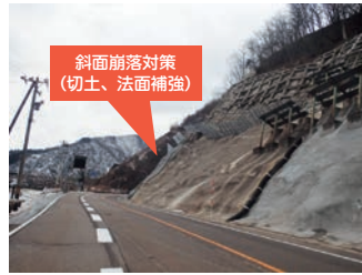
一般国道157号 白山市東二口地内