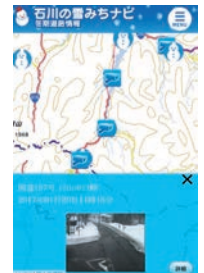
▲スマートフォン版