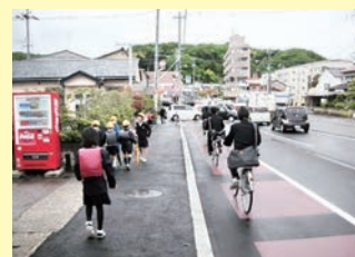
■自転車レーンの整備 東金沢停車場線 金沢市小坂町地内