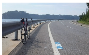
■路面標示によるルート案内

観光誘客の新たなツールとして、本県の豊かな自然、美しい里山里海の景観、観光地や県民のおもてなし等を堪能いただけるサイクリング環境の整備に取り組んでいます。