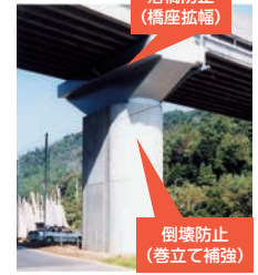
のと里山海道 七尾市中島町北免田地内 (熊木川橋)