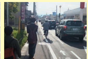
■自転車走行指導帯の整備 倉部金沢線 金沢市米泉地内