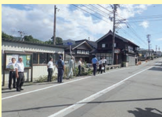
■通学路の合同点検

歩道等の整備にあたっては、沿道状況や交通状況に応じ、側溝に蓋掛けを行うことにより歩行空間を確保するなど地域の実情に応じた整備を進め、安全な歩行空間の早期確保に努めています。