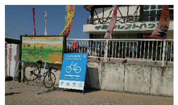
■サイクルラック・サポート施設案内看板