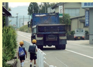
■通学路の歩道整備 七尾鹿島羽咋線 中能登町二宮～小竹地内