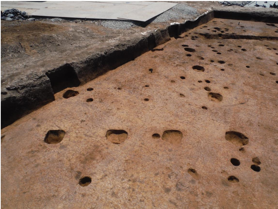
掘立柱建物（北から）