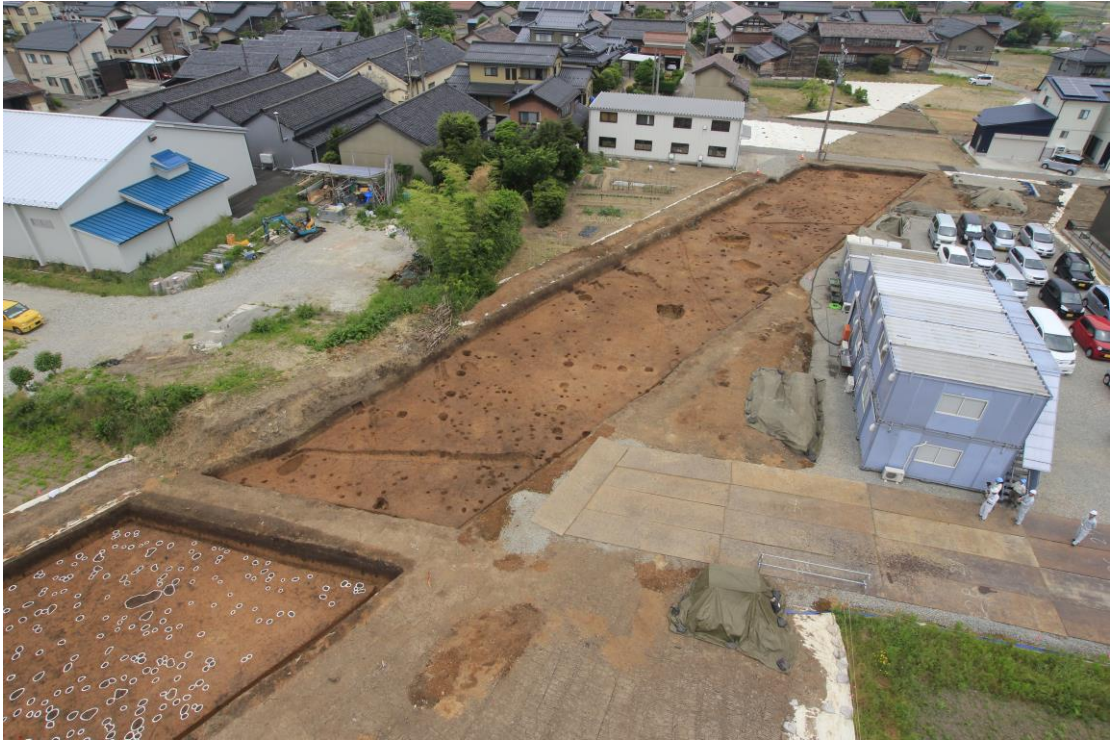
調査区中央部（南から）