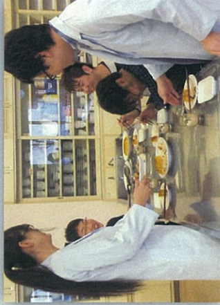
試食&レシピの修正 盛り付け、作り方 などをさらに検討