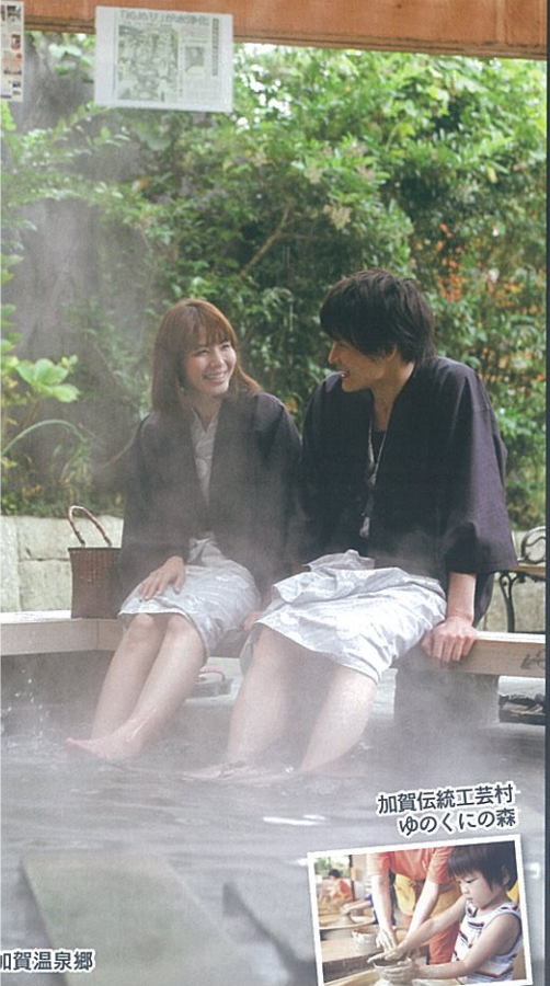
加賀伝統工芸村 ゆのくにの森