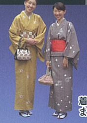
着物でまちあるき

歴史ある街並みをそぞろ歩き、金沢の暮らしに今も息づいている伝統文化を体験しましょう。