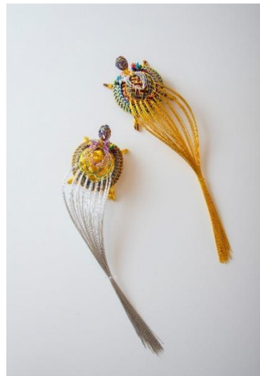
津田水引折型（加賀水引）夫婦亀