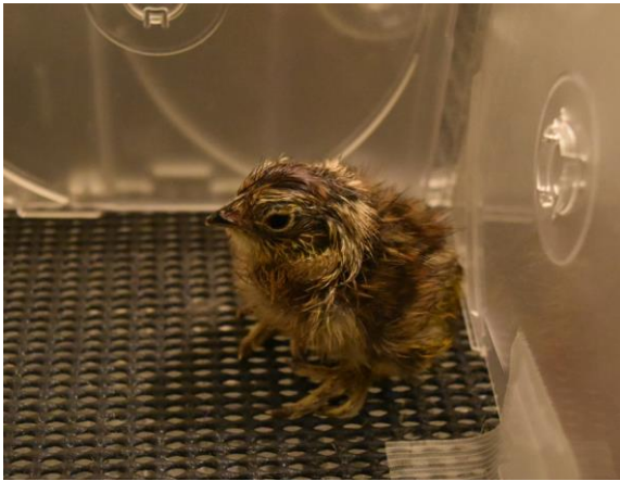
ふ化したライチョウのヒナ