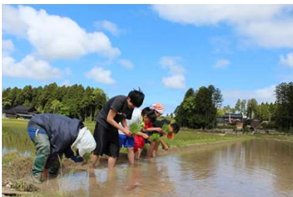
酒米の栽培から醸造まで携わった日本酒づくり

助成率：2/3 助成限度額：1,500千円（2年以内） 対象：農林水産事業者、企業（個人事業者含む）、NPO等