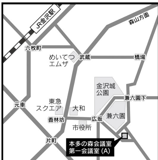
[9月28日・11月8日] 本多の森会議室 (石川県本多の森庁舎内)