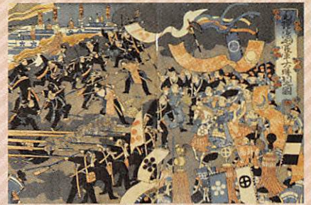
毛理崎山官軍大勝利之図

本展覧会では、幕末の動乱から戊辰戦争、維新の諸変革への対応、さらに明治16年(1883年)に現在の石川県域が確定する過程をたどり、明治前期の政治・社会を地域の視点から紹介します。