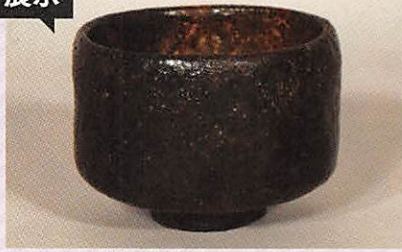
県文《黒楽茶碗 銘北野》長次郎作