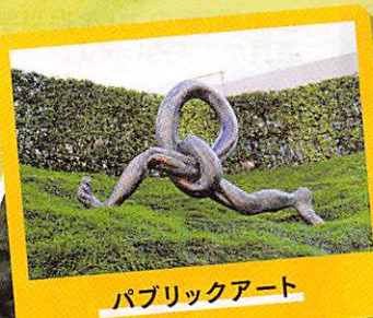
パブリックアート

申 込: 兼六園周辺文化の森活性化推進実行委員会に電話、 もしくは兼六園周辺文化の森HP ( http://kenrokuen-bunkanomori.com ) イベント申込フォーム