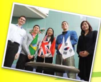
5か国の国際交流員が 皆様をおもてなし！