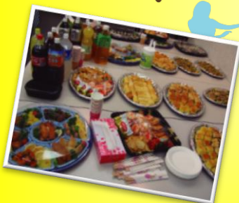
お菓子と飲み物をご用意！