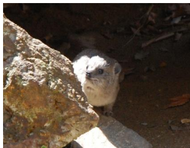
ケープハイラックス