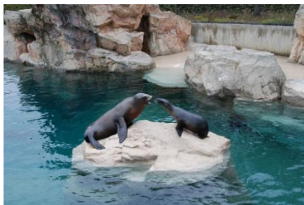
カリフォルニアアシカ

カリフォルニアアシカ／ケープハイラックス／アカクビワラビー／トキ／アミメキリン／グレビーシマウマ