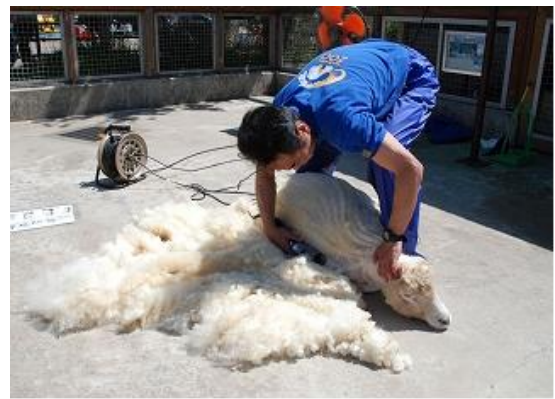
写真② ヒツジの毛刈りの様子(H25年5月)

○[5月3日(土・祝)] (注：雨天順延) ヒツジの毛刈り実演 10:00～11:00