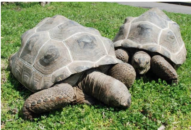
写真③2頭のアルダブラゾウガメ 甲長 53cm と 51cm

インド洋アルダブラ諸島、セイシェル諸島に生息する世界最大級のリクガメ(最大甲長 120cm)。ガラパゴスゾウガメと同様に、ゾウのように体が大きな事と足や皮膚が象に似ていることから、「ゾウガメ」と呼ばれ、最大甲長 120cm にもなるリクガメ界の王様です。