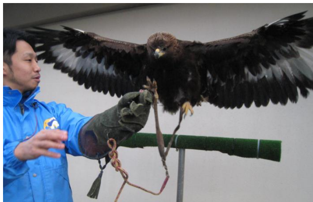
写真① アニマルステージに登場するオスの「大日」 (H25年4月11日ふ化、全長約90cm、翼を上げると約2m)

いしかわ動物園では、H19年からイヌワシの飼育に取り組み、H25年に初めて2羽の巣立ちに成功した。