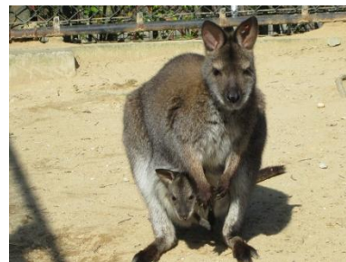
アカクビワラビー