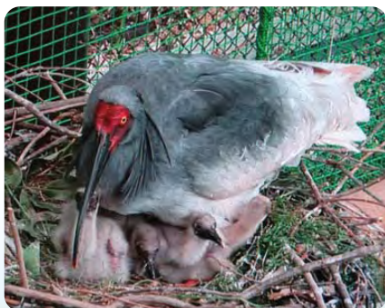
いしかわ動物園のトキの様子