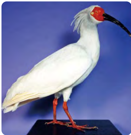
本州最後のトキ 能里(のり)の剥製 (石川県歴史博物館収蔵)

江戸時代初期の加賀藩史料にトキの生息の記録がある。 明治時代から乱獲や生息環境の悪化が進み、急速に生息数が減少。