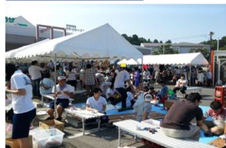
復興イベント・祭り