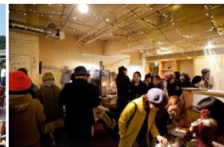
チャレンジショップ