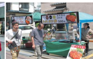
まちバル・グルメイベント