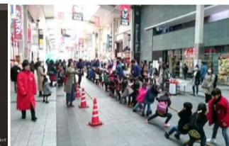
地域体験イベント