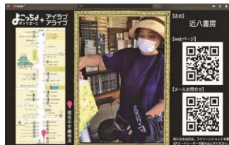
WEBを活用したハイブリットイベント