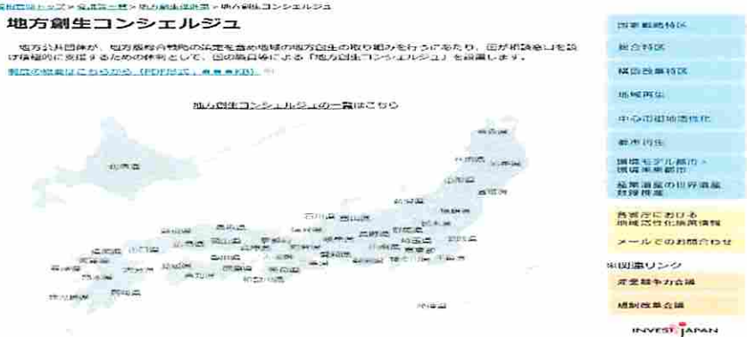
【地図上の各都道府県をクリックすると以下のような名簿を表示】

【地方創生コンシェルジュ・トップページ: http://www.kantei.go.jp/jp/singi/tiiki/concierge/ 】