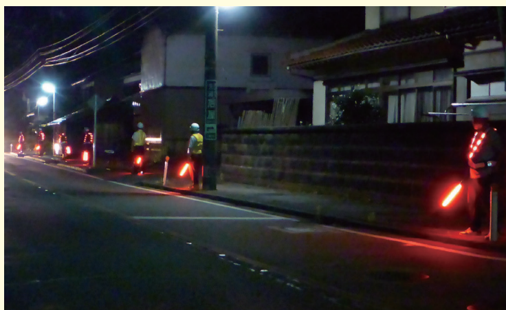
● 夜間のピカピカ隊の実施