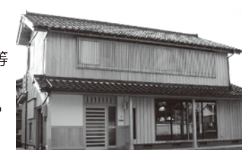
いしかわの木が見えるたてものイメージ