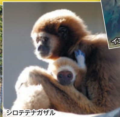
シロテテナガザル