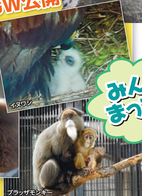
ブラザーモンキー