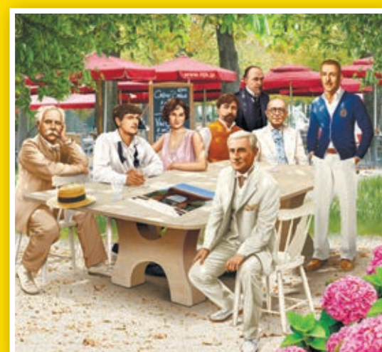
左から時計回りに フォーレ、ドビュッシー、ミシア・セール、アルベニス、サティ、ファリャ、プーランク、ラヴェル

ラ・フォル・ジュルネ金沢チケットボックス(県立音楽堂) ☎076(232)8118 http://www.lfjk.jp