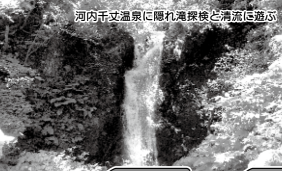
河内千丈温泉に隠れ滝探検と清流に遊ぶ