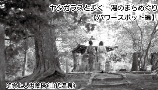
ヤタガラスと歩く 湯のまちめぐり 【パワースポット編】

ホームページ www.pref.ishikawa.lg.jp E-mail e130500b@pref.ishikawa.lg.jp 行政相談 ☎076(225)1100