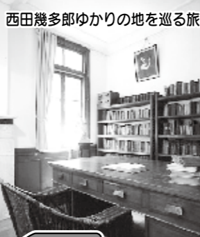
西田幾多郎ゆかりの地を巡る旅