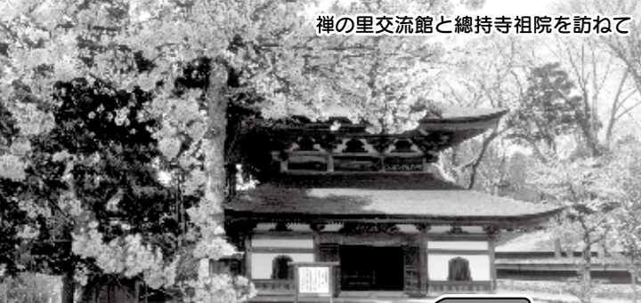
禪の里交流館と總持寺相院を訪ねて