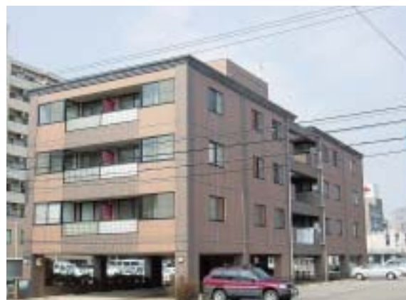
エクセル・シオール外観