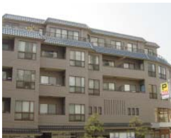
せせらぎ通り百番ビル外観