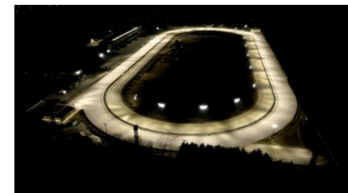
走路照明イメージ