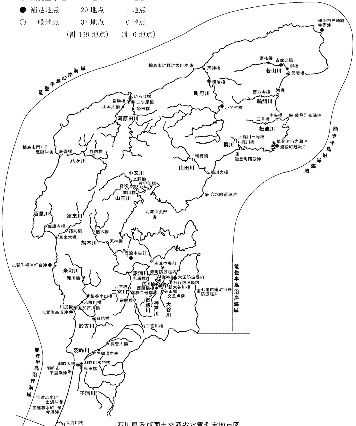
石川県及び国土交通省水質測定地点図