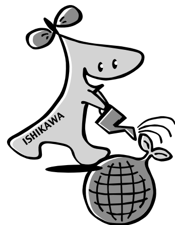
環境総合計画推進キャラクター “エコッピー”