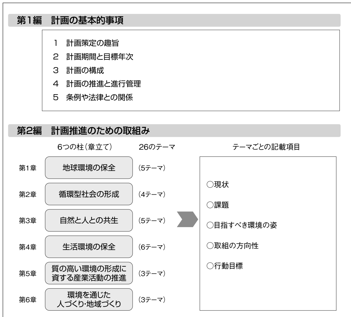
図 環境総合計画の構成（概要）

行動目標は、県民、事業者、行政が協働して取り組むことを基本にして設定し、全体で87項目あります。