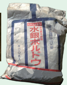
(参考一例) 水銀ボルドウ