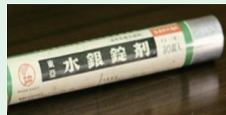
(参考一例) 水銀錠剤

水銀含有農薬には、大きく、紙袋入りの「いもち病対策」と、錠剤の「種子消毒・土壌殺菌用」があります。昭和48年に使用が禁止されましたが、現在でも毎年水銀含有農薬が処理されている実績があり、その多くは大掃除などの機会に排出されています。